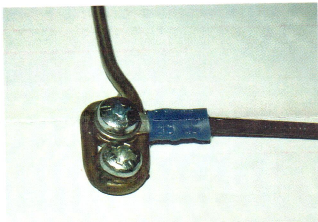
Obr.1 - Detail ukotvení držáku na stěnu a napojení napájecího kabelu.