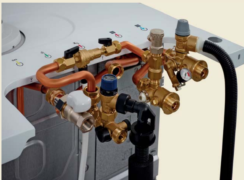
Doporučené příslušenství - připojovací rampa