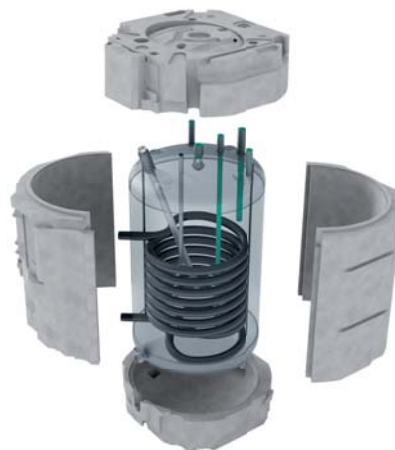
Zásobník teplé vody