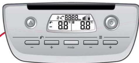
Přehledný ovládací panel pro snadnou obsluhu s velkým podsvíceným displejem